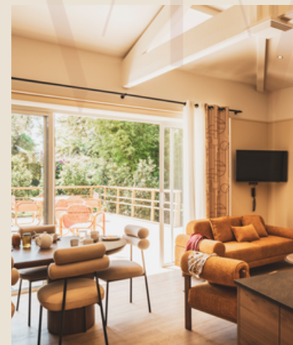
3 appartements 6 personnes 65m 2 et 110m 2

Spacieux, lumineux et chaleureux, nos appartements sont de véritables espaces de vie. Avec leur cuisine équipée et leurs grandes ouvertures sur l'extérieur, chacun possède son propre caractère pour un séjour qui vous ressemble.