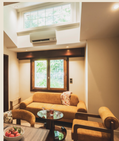
1 appartement 5 personnes 55m 2