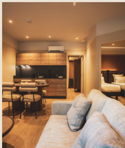
5 appartements 4 personnes 45m 2 à 76m 2