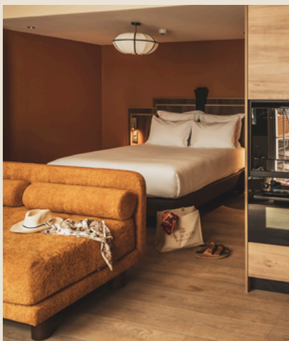
2 studios 2 à 3 personnes 40m 2