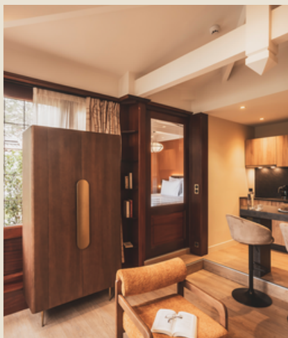
1 appartement 2-3 personnes 40m 2